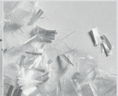
Cellulose Short Cut