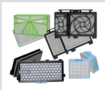
HEPA Filter mini-pleat

Unter unserer Marke CLEAN OFFICE fertigen und vertreiben wir Feinstaubfilter für Laserdrucker.