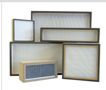
HEPA Filter mit MDF-Rahmen