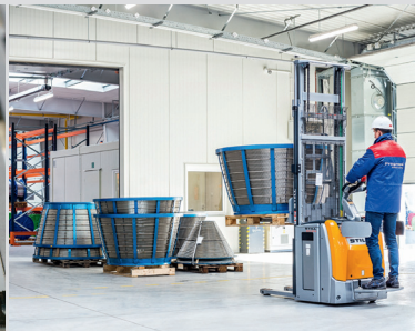
Wedge wire centrifuge baskets