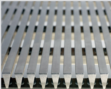
Pro-SLOT® wedge wire screens and tubes

Wir konzentrieren uns vor allem auf Produktivitätsgewinne, Kostensenkung, Verbesserung der Qualität und Kundenbetreuung. Unsere Erzeugnisse stellen wir in 3 Werken in Polen her und liefern in über 60 Länder in fünf Kontinenten. Wir bedienen Weltkonzerne und kleinere Firmen in einer Branche von: Kohlenbergbau, Raffinerie und Petrochemie, Mineralaufbereitung, Nahrungsmittel, Brauereien- und Zuckerindustrie, Wasser-aufbereitung und Abwasseraufbereitung.