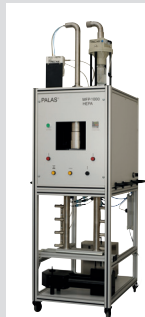
MFP 1000 HEPA

Dank des modularen Aufbaus der Palas® Filterprüfsysteme können die aerosoltechnischen Komponenten einfach und schnell auch für andere Anwendungen verwendet werden.