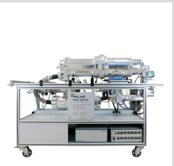
MMTc 2000 EHF