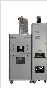
MFP 3000 FTD