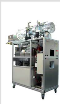
MFP 3000 HF

The modular setup of the Palas® filter test systems allows using the aerosol technical components easily and quickly also for other applications.