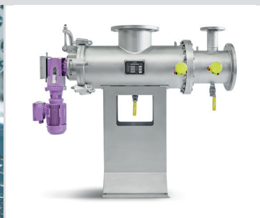
Rückspülfilter Lenzing OptiFil® / Backwash Filter Lenzing OptiFil®