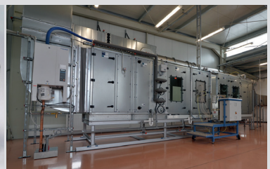
Fully equipped ARAMCO Test Rig Voll ausgestatteter ARAMCO Prüfstand