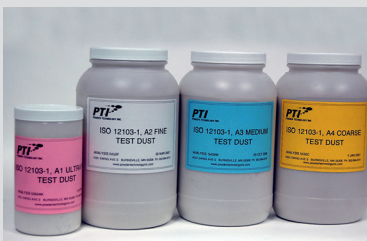
Test Dust e.g. ISO 12103-1 Teststaub wie z.B. ISO 12103-1