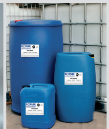
Reverse Osmosis ROPUR® RPI-Antiscalants