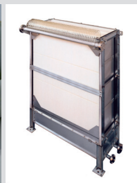
Toray Membrane Bioreactor (MBR) Module