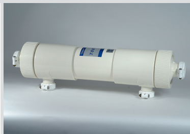
Toray Ultrafiltration (PVDF) Element