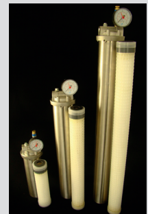
Micro- and ultrafiltration Mikro- und Ultrafiltration