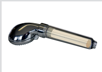
Membrane cartridge in shower Membrandusche