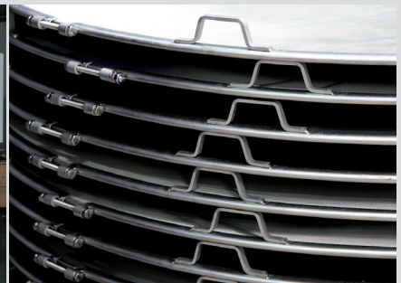
Horizontal pressure leaf filters Tellerdruckfilter