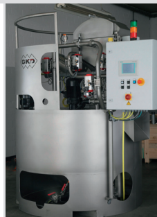
MAXFLOW compact filter MAXFLOW Kompaktfilter