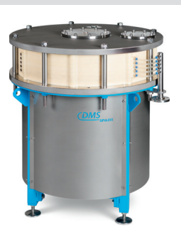
BlueFilter 800 Frontansicht