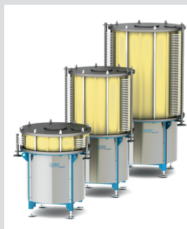
BlueFilter Modellübersicht (BF800, BF1000)