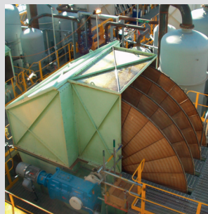
BOKELA Boozer Disc Filter

BOKELA hat ein bestens ausgerüstetes Filtertechnikum und führt Scale-up-Versuche weltweit vor Ort durch.