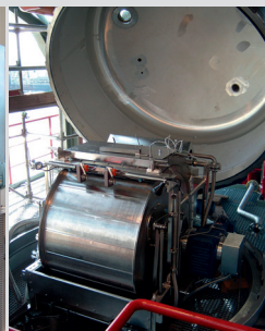
BOKELA HiBar Oyster Filter