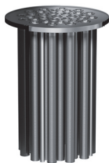
Wedge wire screen cartridges for different filtration levels Spaltsiebkartuschen für unterschiedliche Filtrationsstufen