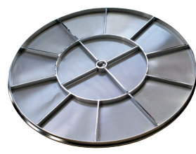
Perforated and ConiPerf bases for dryers and fluid bed systems Loch- und ConiPerf-Böden für Trockner- und Wirbelschichtsysteme