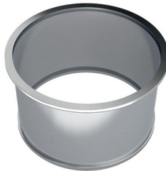
Sieve basket and half-shells for dewatering drainage Siebkörbe und Halbschalen zur Entwässerung