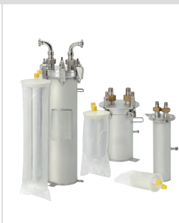
3M™ CTG System