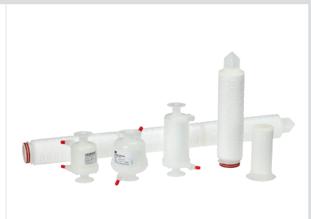
LifeASSURE™ Series Membrane Filter